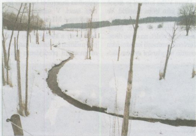
Příklad revitalizace původně zcela regulovaného potoka (Brlou, CHKO Blanský les, 2004)

ly z krajiny. Namísto pramenů a studánek nám zbyly v krajině ohavné betonové roury, které ústí někde na dolním okraji velkého půdního bloku, většinou v houštině kopřiv a černého bezu. V tomto ohledu se dnes nabízí široké spektrum možností a metod, včetně dotací z programů Evropské unie, na základě kterých můžeme vodu vrátit zpět do krajiny a obnovit všechny funkce povrchových vodotečí. A nemusí jít o velké projekty za desítky milionů korun. Často i malý projekt, díky kterému se na povrch dostane několik desítek metrů potoka včetně studánky u jeho pramene, může významně přispět k oživení a ozdravení krajiny. K potokům samozřejmě patří doprovodné dřeviny, stačí vrby a olše, které lze jednoduše ošetřovat a které nemusí stínit okolní pozemky, a samozřejmě by měly být zatravněné zasakovací pásy, jež zamezí znečištění povrchového toku splaveninami. V tomto pro-