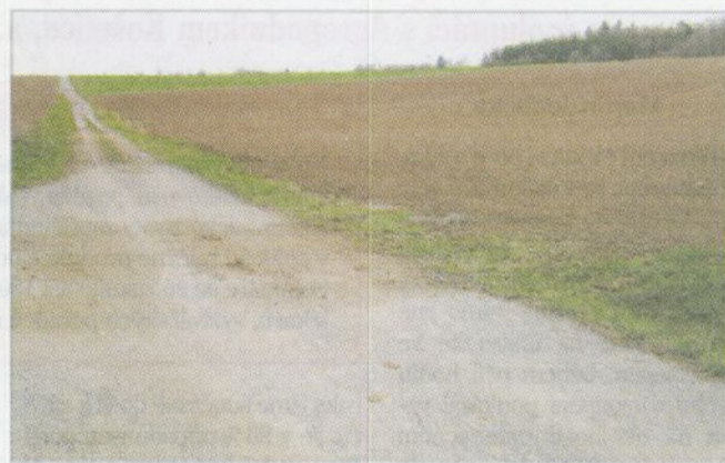
Eroze půdy neznehodnocuje pouze přírodu, ale i cestní síť. V tomto případě jde o komunikaci vybudovanou ze strukturálních fondů Evropské unie (Libina, duben 2013)

Velkou péčí je nezbytné věnovat vodě samotné. Naši předci si nesmírně vážili pramínků a studánek. Údržbu a ochranu studánek a pramenů v krajině považovali po staletí za samozřejmou věc, protože si uvědomovali, že jsou na kvalitní vodě životně závislí nejen oni i jejich hospodářská zvířata, ale udržovaná prameniště mohou být místem s bohatým výskytem i vzácných rostlin (například léčivých bylin) a živočichů. V tomto ohledu u nás docházelo v šedesátých až osmdesátých letech dvacátého století k ničeni těchto míst v neuvěřitelném rozsahu. Prameny a pramenné stružky byly uzavřeny do podzemních potrubí a horní části toků se na stovkách metrů i kilometrech ztráti-