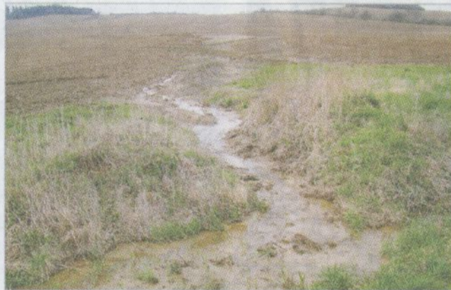
Vodní eroze na pozemku nepřilíh svažitém, ale příliš rozsáhlém (Libina, duben 2013)

těl a dopouští a která se v minulosti projevovala regionálně a postupně v řádech desetiletí nebo dokonce staletí, se nám dnes vrací během několika málo let. Je to na jedné straně možná poněkud depresivní poznatek, ale na druhou stranu nám může poskytnout naději, že jsme schopni provést i nápravu včas rozpoznávaných špatných rozhodnutí a špatných projektů rovněž během několika málo let. Bohužel, musíme při tom počítat s tím, že následky špatného hospodaření v krajině, jakými jsou například ztráta erodované půdy nebo vyhynutí některých druhů organismů, si vyžadují dobu mnohdy podstatně delší, pokud vůbec jsou tyto procesy vratné. Ztracená retenční kapacita krajiny, kte-